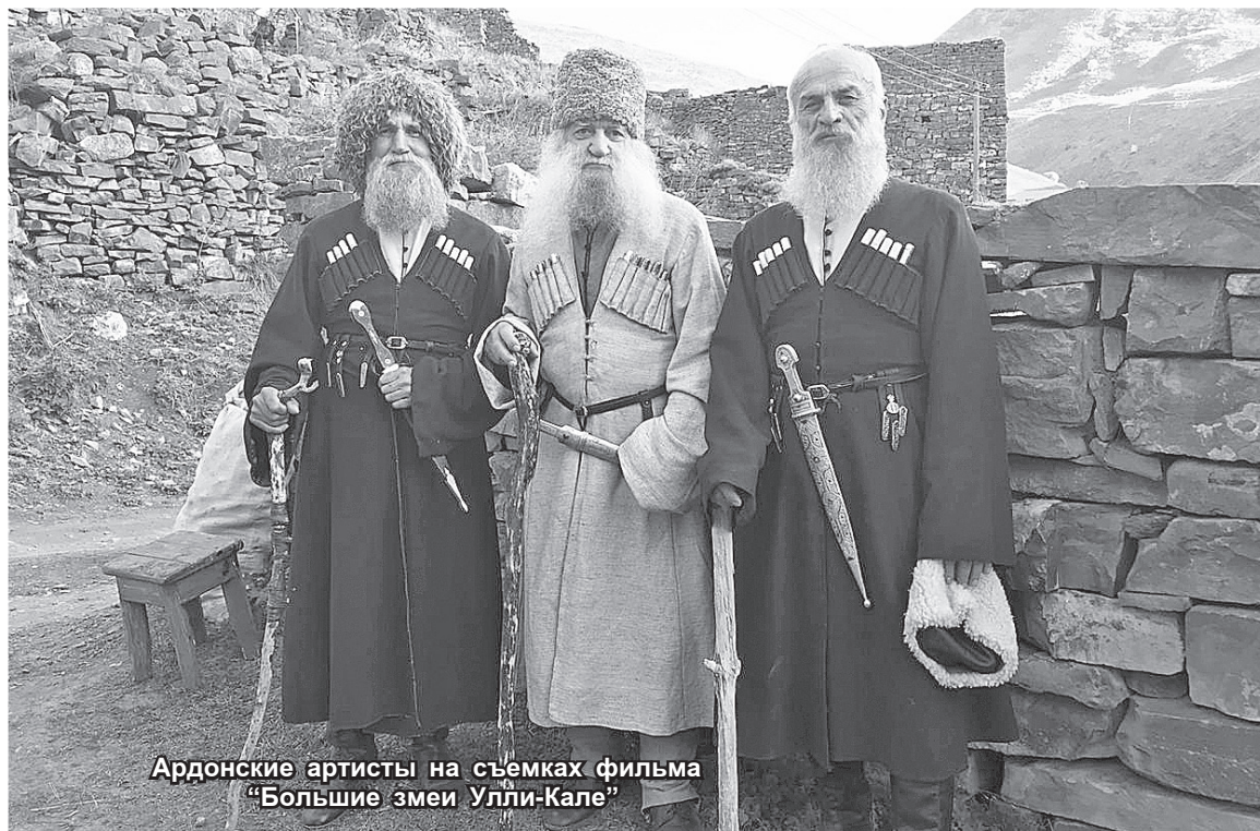
Ардонские артисты на съемках фильма «Большие змеи Улли-Кале»

Картина с рабочим названием «Большие змеи Улли-Кале» режиссера Алексея Федорченко – исторический фильм о взаимоотношениях России и Кавказа в XIX веке, в самый разгар Кавказской войны. Она еще не вышла на большой экран, поэтому рассказывать о сюжете преждевременно. Скажем только, что снималась кинолента в 2020 году, в том числе и в горах Северной Осетии. Для массовых сцен из числа артистов Ардонского театра были выбраны